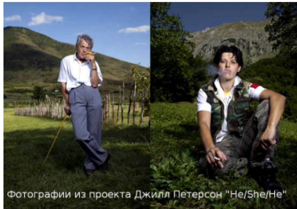
Фотографии из проекта Джилл Петерсон "He/She/He"

Традиция обета девственности уходит корнями в Кодекс Лека Дукаджина — кодекс поведения, который передавался из уст в уста среди кланов северной Албании на протяжении пяти веков. Согласно кодексу, роль женщины жестко ограничена заботой о детях и доме. Цена женской жизни составляет половину мужской, в то время как